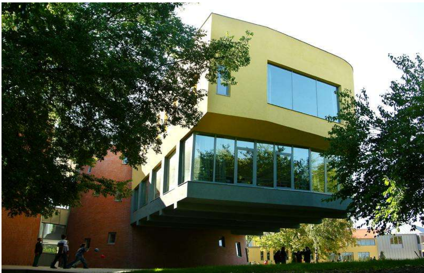
Rajz és ének tantermek