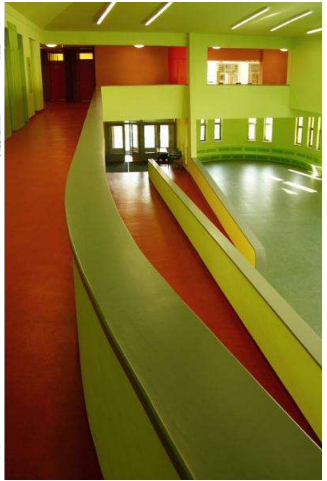
Bejárat és auala