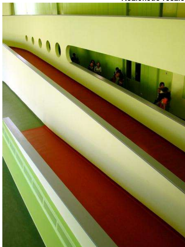
Közlekedő és aula részlet